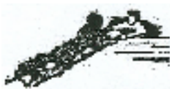
Leiter als Hilfsmittel