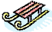
Schlitten (Kufe oben)