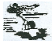
Stange oder Ast als Hilfsmittel