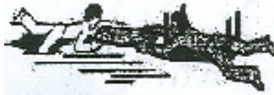
Bank oder Brett als Hilfsmittel

Mit langen Stangen oder Leinen kann auch mit Sicherheitsabstand zur Einbruchsstelle dem Verunfallten geholfen werden.