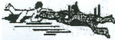
Bank oder Brett als Hilfsmittel

Mit langen Stangen oder Leinen kann auch mit Sicherheitsabstand zur Einbruchsstelle dem Verunfallten geholfen werden.